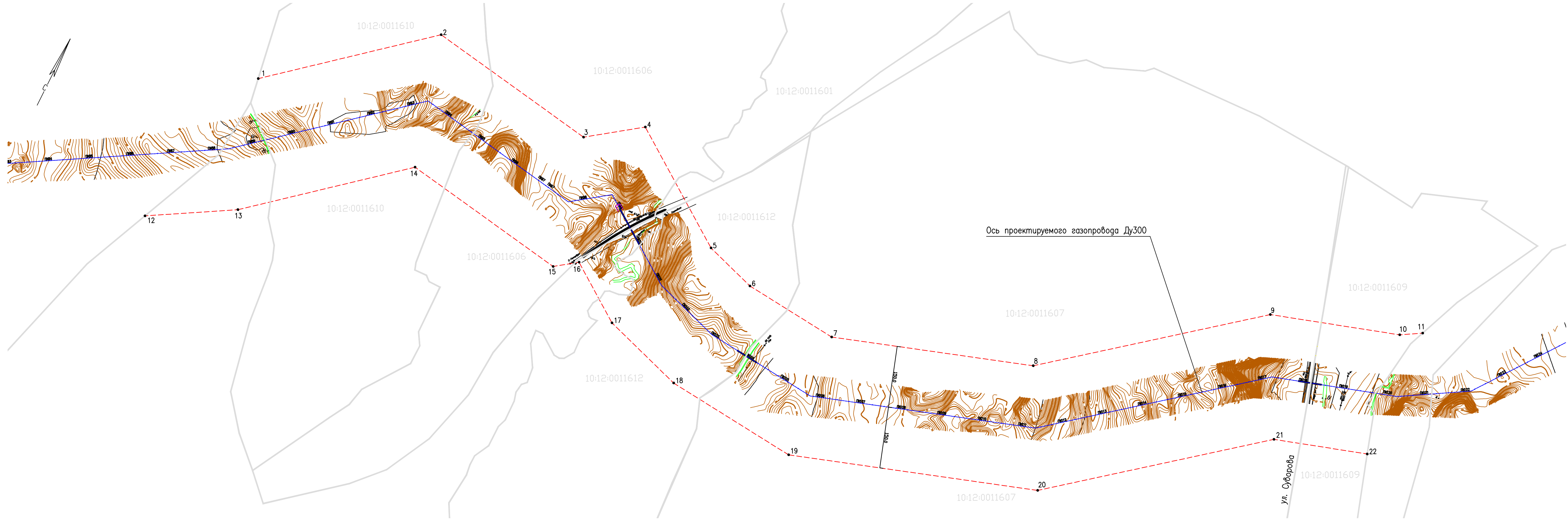
Координаты вершин проектируемой границы населенного пункта